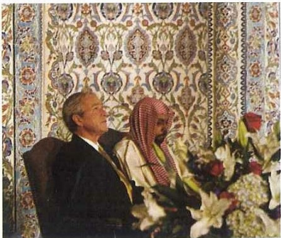
GEORGE W. BUSH A WASHINGTON